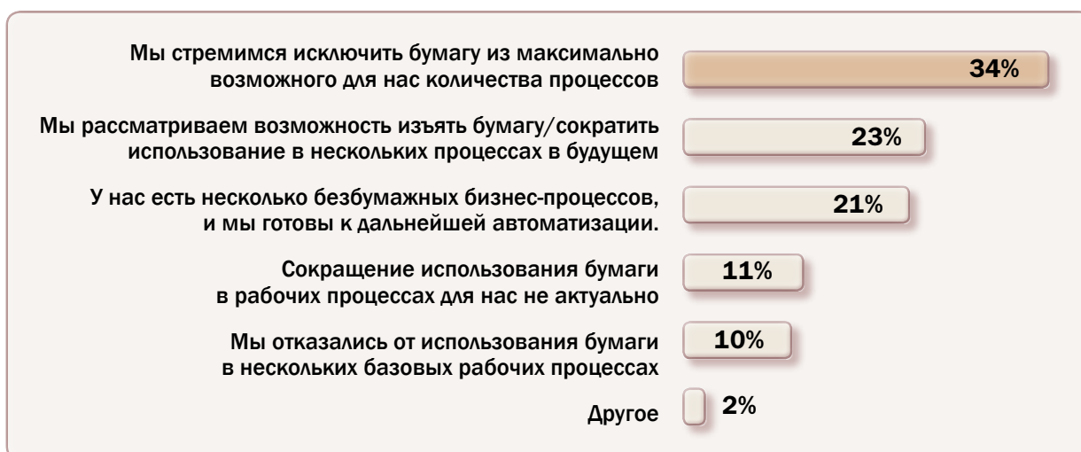
Рис. 1. Причины перехода компаний на безбумажный документооборот.

Актуальной потребностью предприятий становится не только автоматизация документооборота, но и замена уже существующей СЭД на новую. В процессе непрерывного развития систем электронного документооборота изменилась их технологическая база; задачи, которые способны решать современные СЭД, формируют новые требования к системе со стороны их пользователей. Внедренные некогда СЭД нуждаются теперь в доработке, а собственные разработки — в непрерывном обновлении. Несмотря на всю «болезненность» для сотрудников процесса смены привычного уклада работы с документами, руководство компаний решается на замену СЭД.