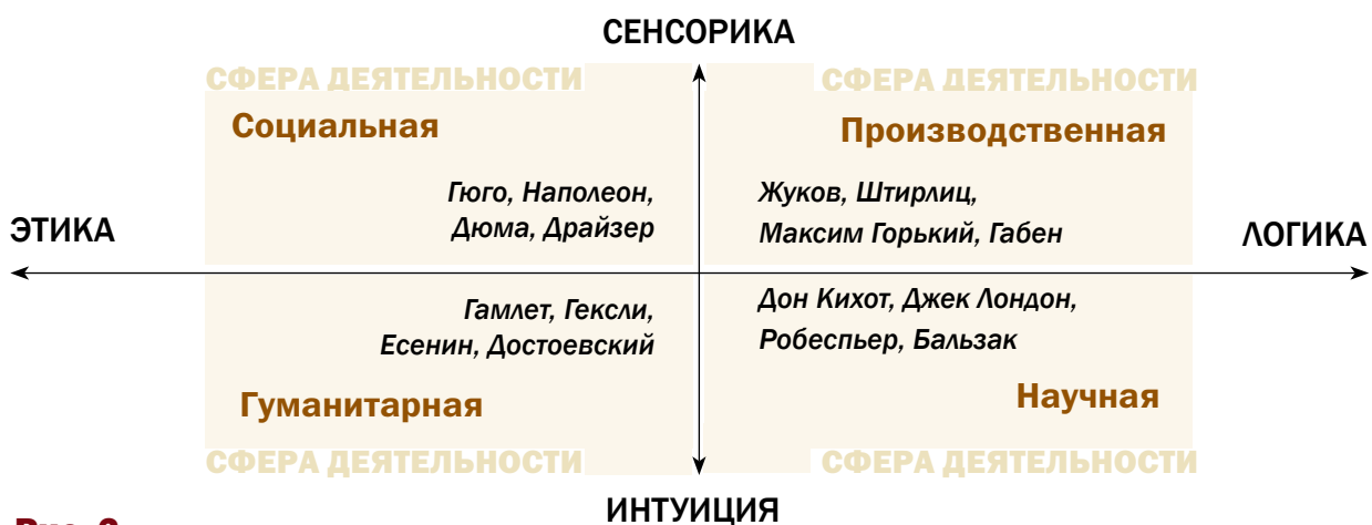
Рис. 2. Соционика и сферы деятельности в условиях рынка

Социальный стиль мышления носит конкретный характер, поскольку имеет дело с реальными вещами, при этом он направлен на человека с его индивиду-