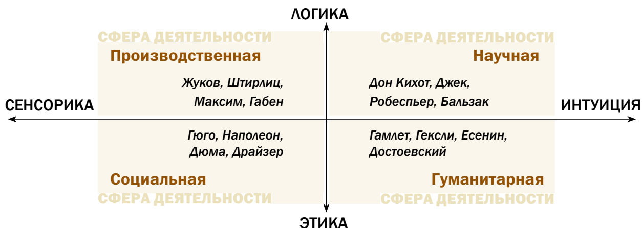
Рис. 1. Соционика и сферы деятельности (схема профорientации)

ных сфер деятельности, но не радикально, и старые названия этих сфер можно сохранить (рис. 2). На первое место выдвигается социальная сфера — сфера услуг, остальные сферы дополняют ее.